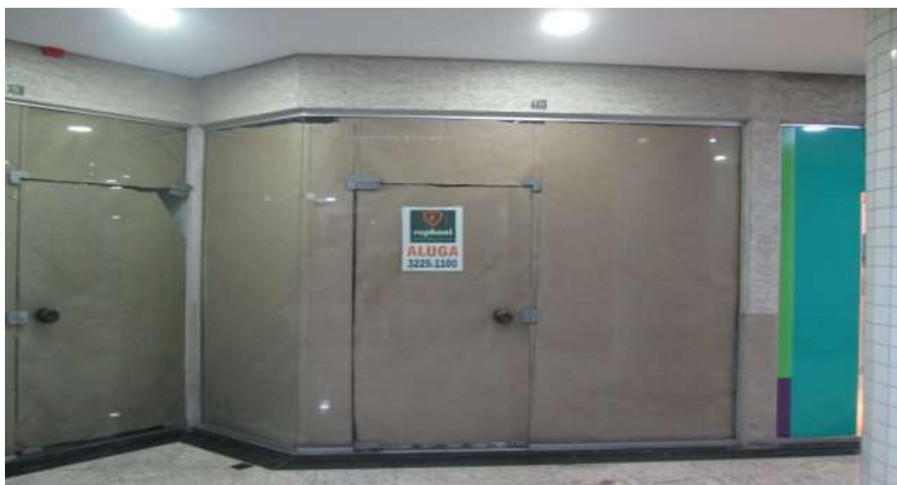
Vista da loja 10