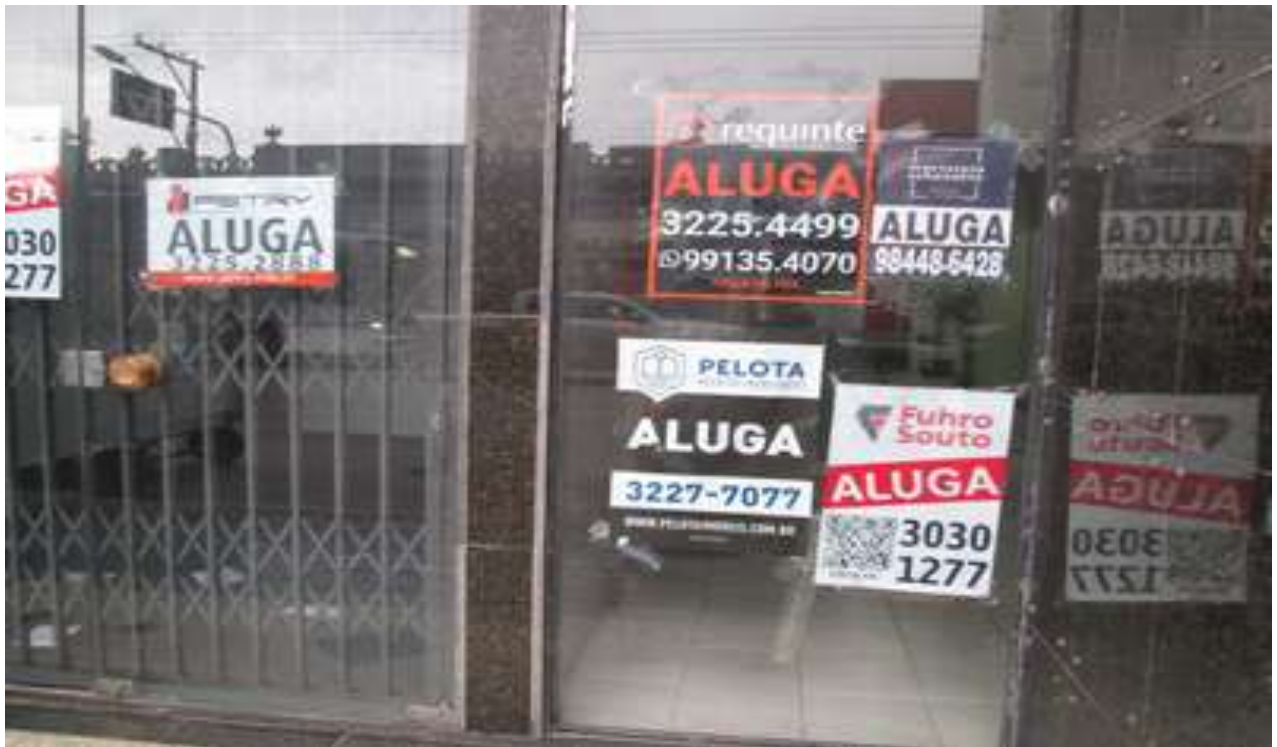
Figura 11 - Algumas lojas desocupadas para locação