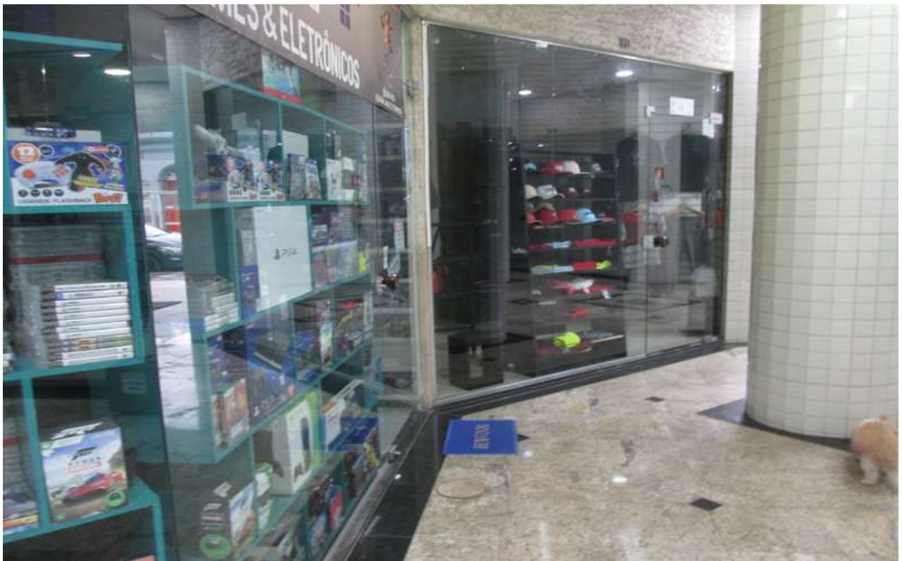
Figura 10- - Vitrine de alguma lojas em funcionamento na galeria