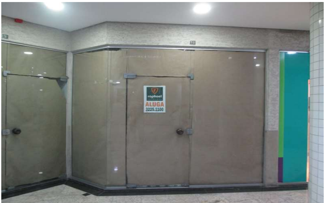
Figura 6 - Fachada da Loja 10