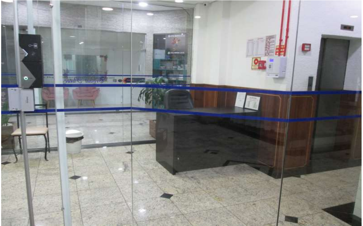
Figura 9- Portaria