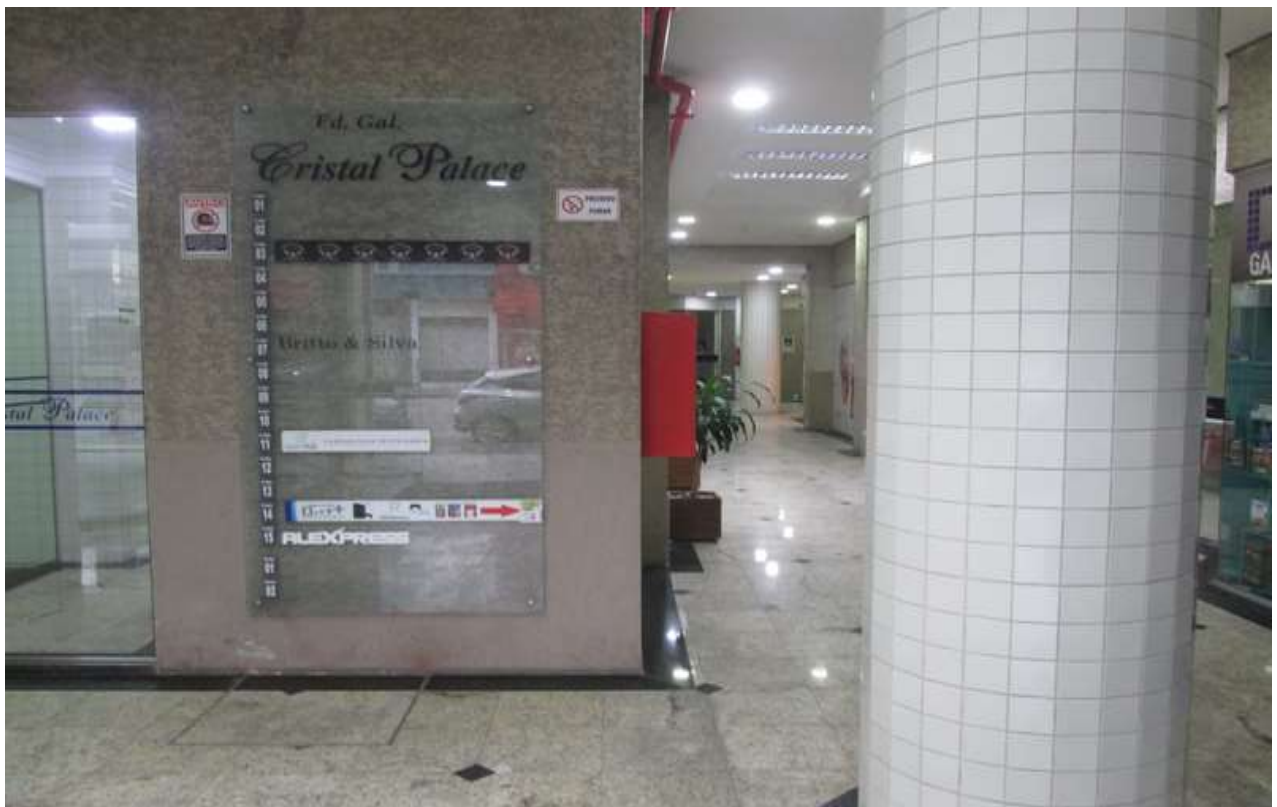
Figura 4 -Visão interior /entrada