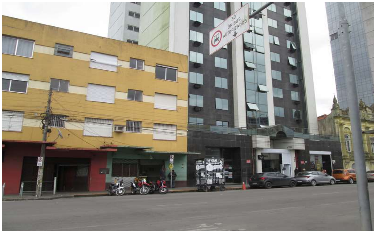
Figura 1 - Fachada do prédio pela Rua General Osório