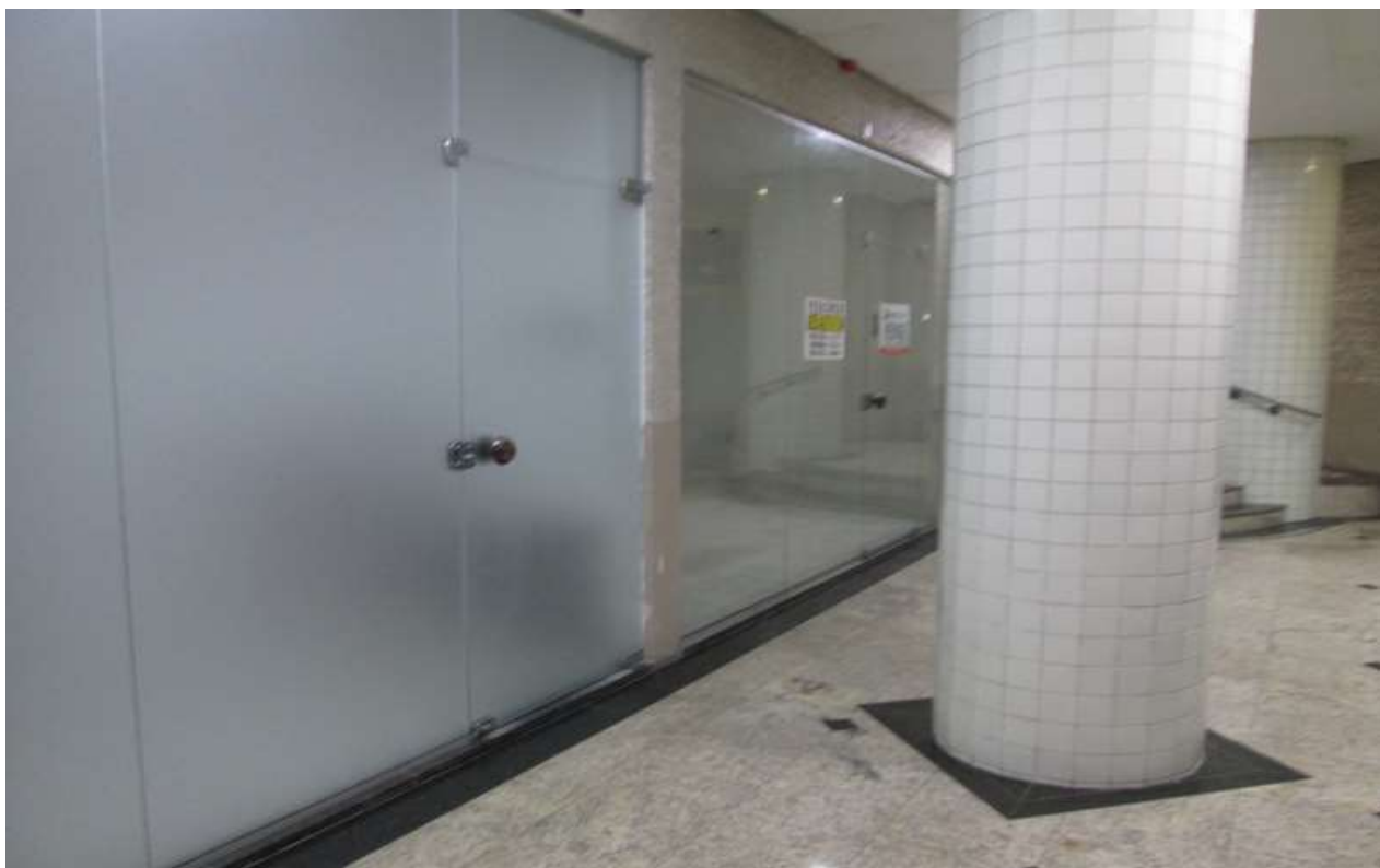
Figura 13 - Loja a venda na mesma galeria