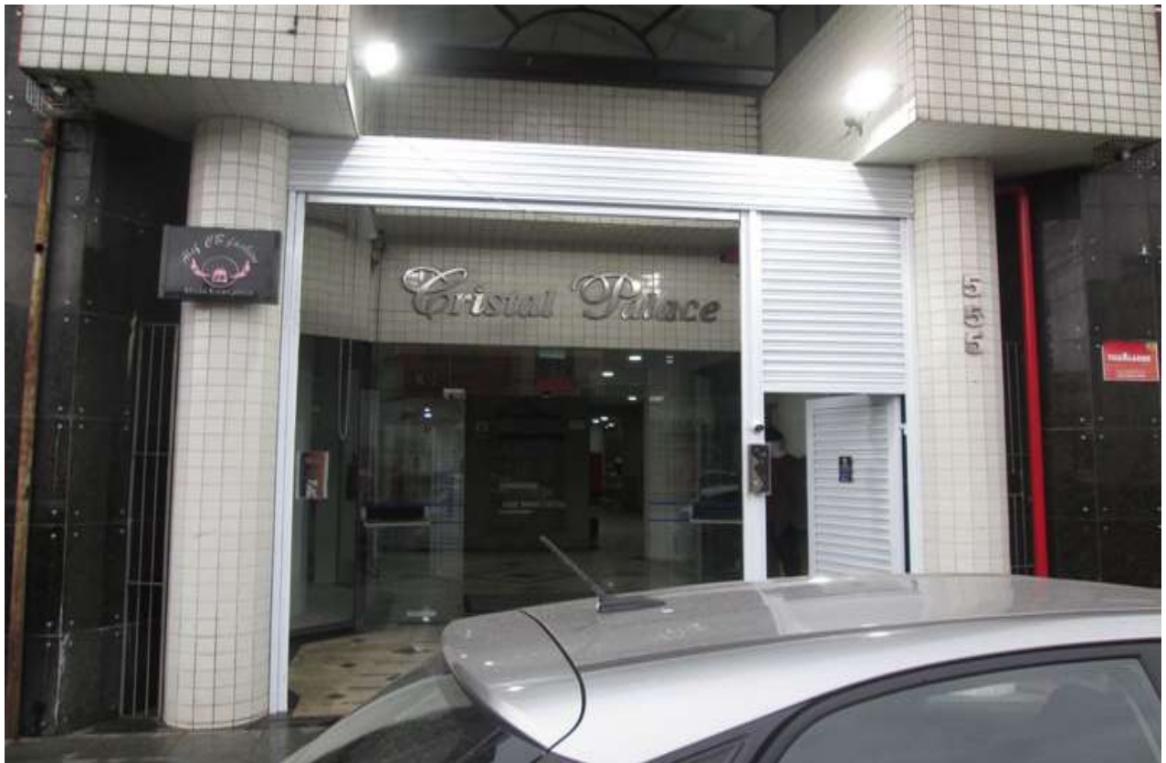
Figura 3 - Entrada prédio