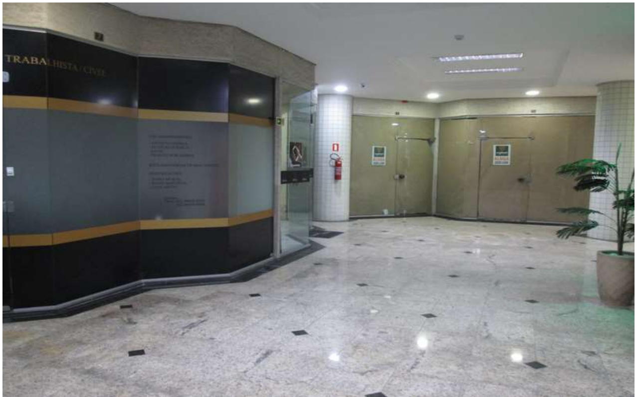
Figura 5 - corredor aos fundos com vista da fachada da loja 10