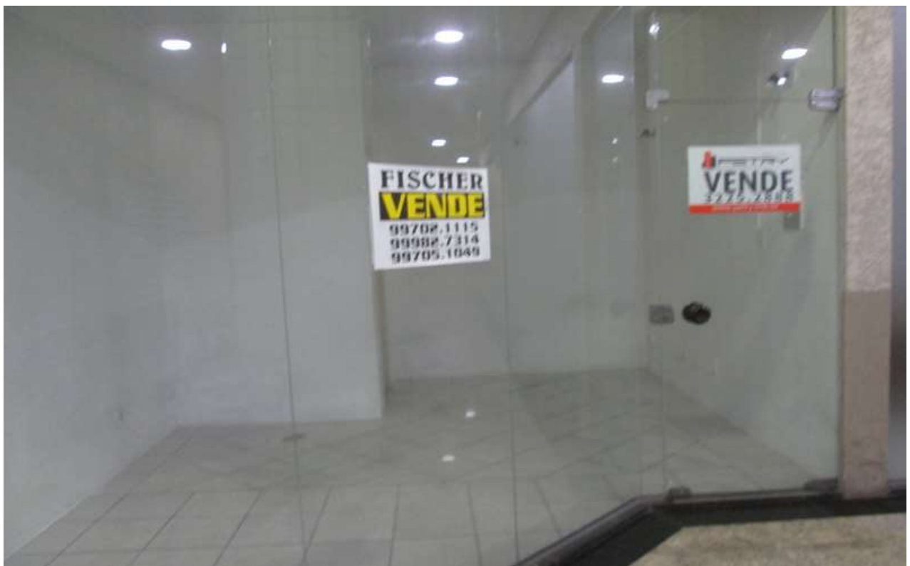
Figura 12 - Loja semelhante ao imóvel avaliando à venda na galeria do Edifício Cristal Palace