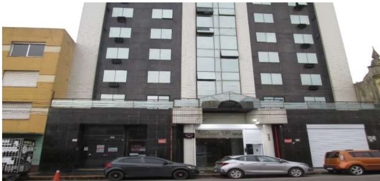
Vista da fachada do Condomínio Cristal Palace