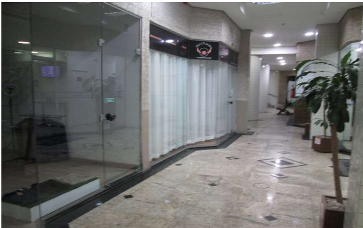
Figura 7 - Vista interna do corredor do térreo