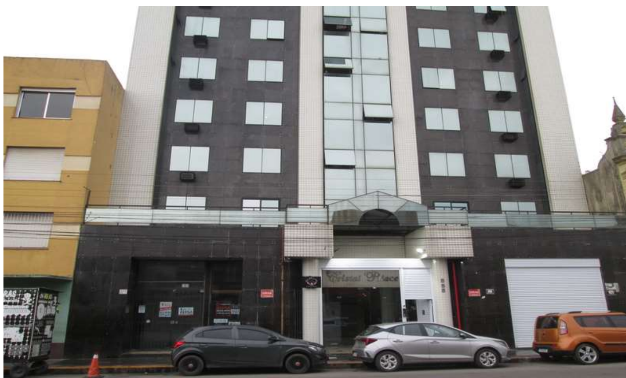
Figura 2 - Fachada do prédio